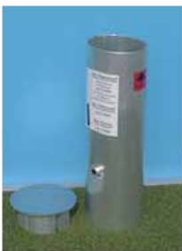
Zemní pouzdro Standard Obj.č. 10H02001 Hliníkové pouzdro s odjímatelným víčkem.

Pro jednodušší instalaci je toto zemní pouzdro vyrobeno již ve správném úhlu zakřivení tak, aby sloupky byly ve správné pozici po napnutí sítě. Víčko je vodorovně k hrací ploše a horní okraj pouzdra je ve stejné úrovni jako horní část povrchu hrací plochy. Víčko může být při instalaci opatřeno libovolným povrchem.