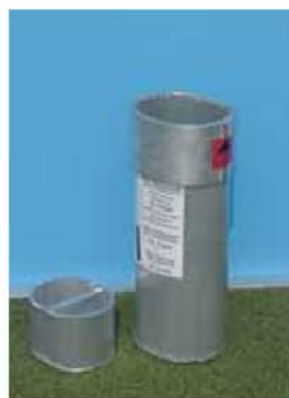
Zemní pouzdro s vystužením Obj.č. 10TH2001 Pouzdro s lapačem prachu pro instalaci ve sportovních halách.