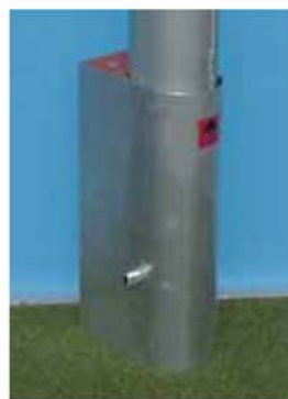
Zemní pouzdro Speciál, Obj. č. 10SH2005 Konstrukce umožňuje ukládání víčka v těle pouzdra a je jeho pevnou součástí. Víčko může být při instalaci opatřeno libovolným povrchem.